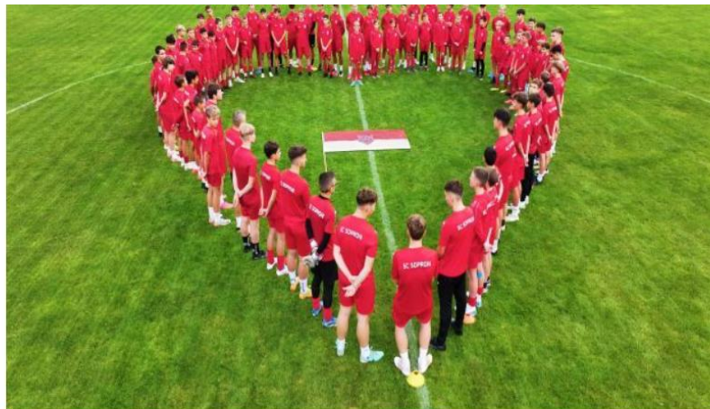
Az SC Sopron focistái is csatlakoztak a kezdeményezéshez.

Több városi sportszervezet is csatlakozott a Soproni Gyógyközpont idej, szlv világnapi közösségi aktivitásához, hogy egyedi formációkkal és szlv világnapi üzenetekkel hívják fel a figyelmet a testmozgás egészségmegőrző szerepére.